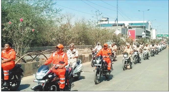
शहर में निकाली गई जागरूकता रैली।