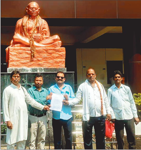
कलेक्टर कार्यालय पहुंचे समाज के प्रमुख।

सर्व पिछड़ा वर्ग ने मांग की है कि जनगणना प्रपत्र में ओबीसी वर्ग के लिए स्पष्ट अलग कॉलम जोड़ा जाए, ताकि उनकी वास्तविक