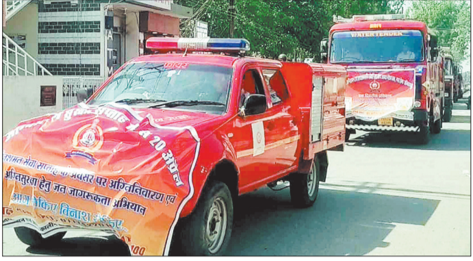
शहर में निकाली गई जागरूकता रैली।