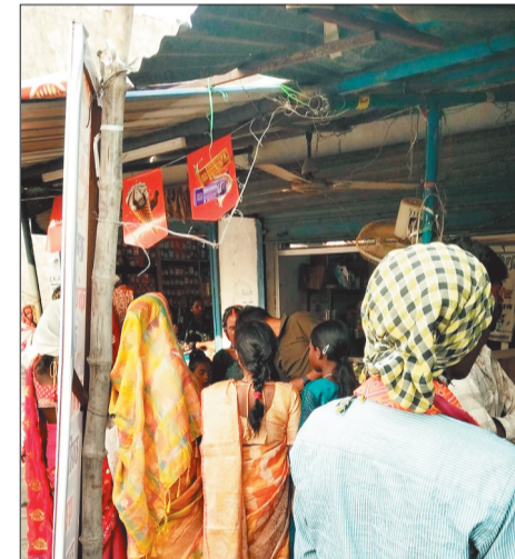
दुकान में भीड़-भाड़।